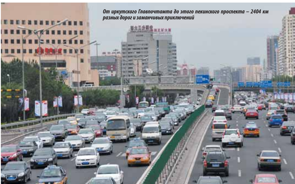
От иркутского Главпочтамта до этого пекинского проспекта — 2404 км разных дорог и заманчивых приключений

Из личного опыта — пришел в консульство в среду, предварительно заполнив анкету, приложив к ней паспорт, фото, бронь отеля и авиабилеты. Подача документов (небольшая очередь) заняла 15 мин., получение паспорта с визой — ровно через неделю (без очереди) — 5 мин. Оплата (1500 руб.) при получении. При втором походе необходимо иметь российский паспорт — для предъявления охране на 1-м этаже.