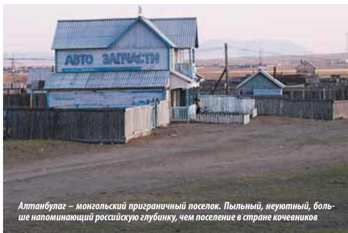
Алтанбулаг — монгольский приграничный поселок. Пыльный, неуютный, больше напоминающий российскую глубинку, чем поселение в стране кочевников

Примерно на трети пути между Алтанбулагом и Улан-Батором расположен второй по величине город Монголии — Дархан (население 73500 чел.), основанный советскими специалистами как индустриальный центр в 60-х годах 20-го века. Город застроен типичными пятиэтажками-«хрущевками», но в отличие от столицы здесь много свободного пространства и нет пробок. Навигация по городу проблем не вызывает. На кольцевой развязке можно держаться прежнего направления, а можно взять левее и проехать через Новый город (в дальнейшем главная дорога снова выведет на трассу до Улан-Батора). На упоминавшемся уже кольце расположены две скульптурные композиции, соединенные подвес-