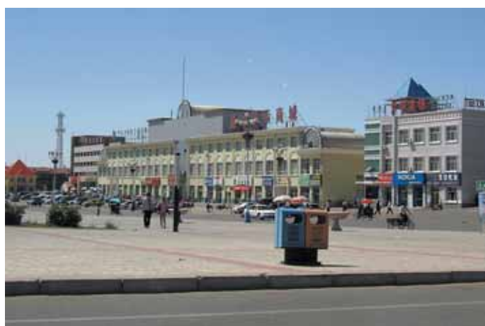
Эрен-Хото — по-монгольски «Разноцветный город». 100-тысячный промышленный китайский город и транспортный узел на границе с Монголией. Свободная экономическая зона. Центр шопинга, ориентированный на монгольских челноков. Парк динозавров (здесь были обнаружены останки древних динозавров и яйца).

ки песчаных дорог и блуждания среди саксаула в поисках проезда в Нэмэгэтинской впадине — теперь широкая, как взлётная полоса для истребителей и прямая, как полёт стрелы грейдерная дорога, по которой легко можно ехать 80 км/час. Снятый грейдером