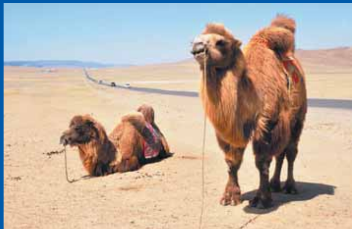
Дорога на участке Улан-Батор – Чойр

мелькают полузаброшенные советские военные городки, а в районе Чойра — военный аэродром. Самый крупный город на этой дороге — 20-тысячный Сайншанд , который развивается благодаря месторождению коксующихся углей. В городе есть музей с экспозицией, посвященной животному и растительному миру, а также артефактам пустыни Гоби. По соседству с Сайшандом (40 км к югу) есть реконструированный буддийский монастырь Хамарын хиид (построен в 1821 году, разрушен в 30-х годах XX века). Когда-то здесь был первый в Монголии театр и храмо-