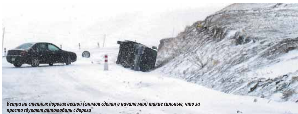
Ветра на степных дорогах весной (снимок сделан в начале мая) такие сильные, что просто сдувают автомобиль с дороги

Сразу за шлагбаумом пограничной зоны начинается монгольский поселок Алтанбулаг (население — 3,3 тыс. человек) — непривлекательный, с хаотичной деревянной застройкой, на окраинах можно встретить юрты. Первый крупный город и большая железнодорожная станция — Сухэ-Батор (население — 19700 чел) — центр Селенгинского аймака. Пока граница не работает в круглосуточном режиме, это хорошее место для остановки следующих из/в Россию (стоимость номера в гостиницах — 20000–50000 тугриков/465–1160 руб). На посту дорожной полиции (будьте внимательны — местные