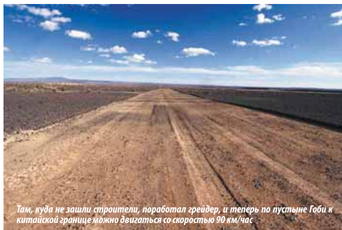
Там, куда не зашли строители, поработал грейдер, и теперь по пустыне Гоби к китайской границе можно двигаться со скоростью 90 км/час

До Пекина два раза в неделю можно добраться поездом (№ 4 Москва-Пекин и № 24 Улан-Батор-Пекин, 13 часов), автобусом (10 часов, 7 рейсов в день, билет 200 юаней/1000 руб.) и самолетом (билеты из аэропорта Erenhot можно заказать на сайте elong.net , стоимость в одну сторону от 550 юаней/2750 руб., 50 мин. в полете).