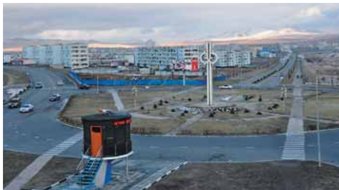
Дархан — второй по величине город Монголии. Напоминает российские моногорода, что неудивительно — был построен советскими специалистами как индустриальный центр

Еще недавно асфальтированная дорога из Улан-Батора была только до Чойра (238 км). Далее до границы с Китаем были только гравийные накаты, в которых легко было заблудиться, если не придерживаться ориентира — проходящей параллельно Трансмонгольской железнодорожной магистрали. Путь на автомобиле занимал до 20 часов с промежуточной ночевкой. Строительство трассы Чойр — Сайшанд (226 км) — Замын-Ууд (212 км) с привлечением