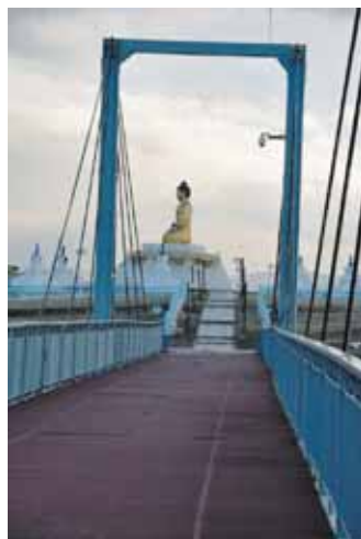
Статуя Золотого Будды в Дархане — расположена прямо у главного шоссе на Улан-Батор

иностранных инвестиций планировалось еще в 2007 году, но тогда удалось сделать только 10 км дороги. Активное строительство началось весной прошлого года и сейчас в асфальте уже большая часть дороги — 250 км, а на остальных 188 км — отличная гравийка, позволяющая даже на легковом автомобиле ехать со скоростью 80–90 км/час. Полностью 428 км дороги Чойр — Сайшанд — Замын-Ууд будут сданы осенью 2013 г. Это будет современная асфальтобетонная двухполосная (шириной 10 метров) скоростная дорога, требующая ремонта раз в 30 лет. Для сравнения — строящиеся российские дороги на двухслойной подушке с нижним слоем из песка и верхним — щебне-ночным, требуют ремонта раз в 7–8 лет. Подписанный в 2008 году контракт «Вызов тысячелетия» оценивает стоимость работ в $285 млн. — т.е. стоимость 1 км дороги более $1 млн. Генподрядчики — южнокорейская корпорация Halla, построившая множество дорог, промышленных комплексов и отелей, и крупная китайская компания Jianshi, которая поставляет необходимое оборудование и материалы. Уже сейчас от Улан-Батора до Китая можно дое-