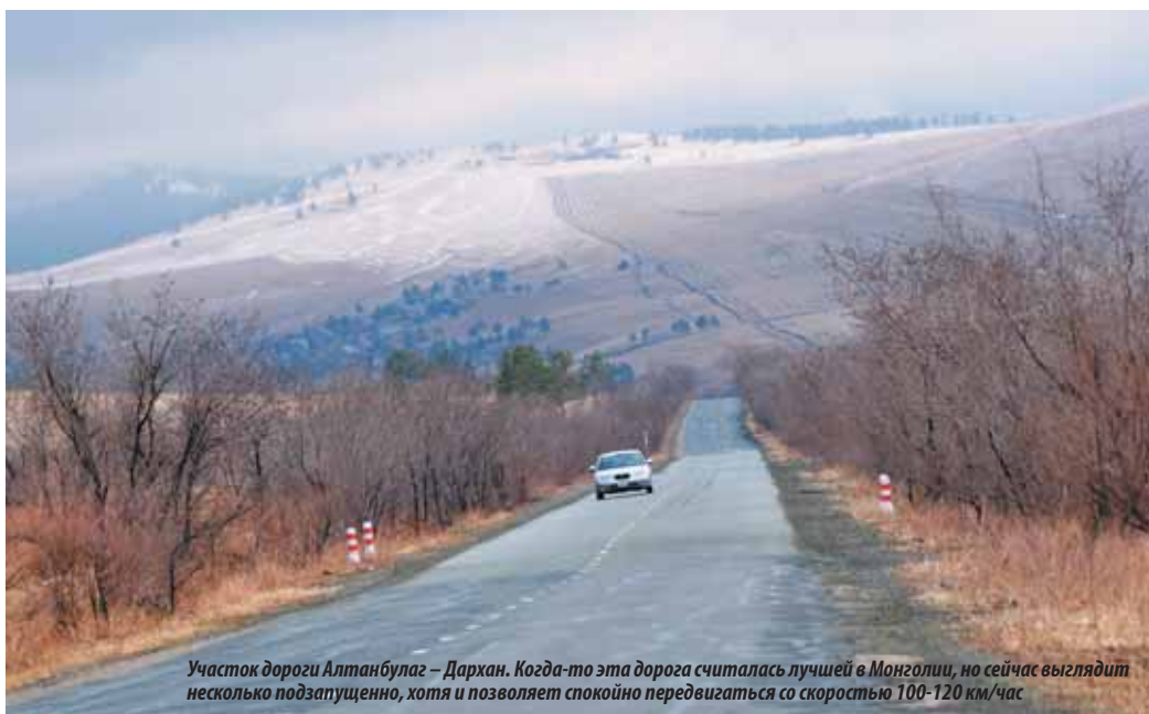
Участок дороги Алтанбулаг – Дархан. Когда-то эта дорога считалась лучшей в Монголии, но сейчас выглядит несколько подзапущенно, хотя и позволяет спокойно передвигаться со скоростью 100-120 км/час

ным мостом. Справа (по ходу движения в Улан-Батор) — достаточно неряшливая Статуя Сидящего Будды , слева — более ухоженная Композиция Морин Хуур с небольшим парком и смотровой площадкой. Примерно в километре не доезжая кольца по основной трассе (в так называемом Старом городе ) расположен буддийский Монастырь Хараагийн (8.00–18.00), размещающийся в красивом бревенчатом доме.