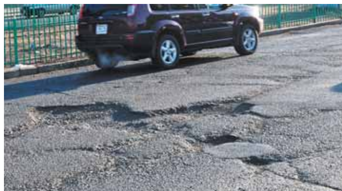
Даже на центральных улицах Улан-Батора — многочисленные ямы и выбоины

вый комплекс, а сейчас — два небольших храма. Монастырь посвящен известному монгольскому просветителю Данзаравжаа. Местные жители считают его живым богом. От монастыря начинается трехкилометровая ритуальная дорога в Шамбалу, вдоль которой стоят 126 ступ — до беседки с колоколом. Далее посреди пустыни находится комплекс из 108 ступ и ритуальных сооружений. Для многочисленных паломников это место считается энергетическим центром планеты и входом в мистическую Шамбалу. По соседству есть несколько пещер для медитации.