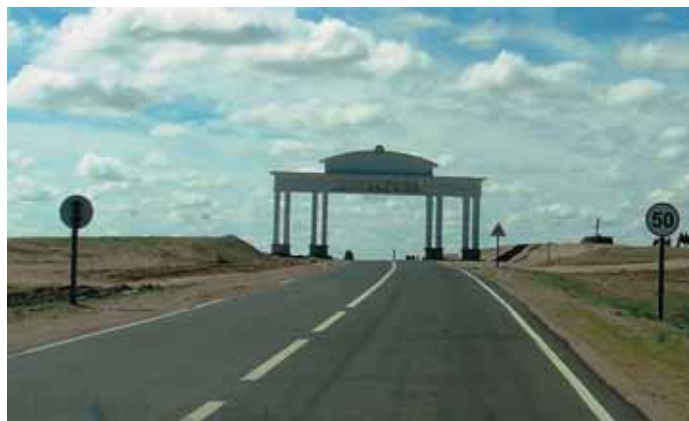
На участке Чойр – Сайншанд участки активного строительства чередуются с отличным новым шоссе