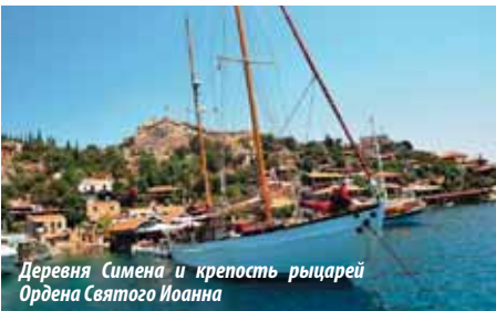
Деревня Симена и крепость рыцарей Ордена Святого Иоанна