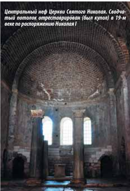
Центральный неф Церкви Святого Николая. Сводчатый потолок отреставрирован (был купол) в 19-м веке по распоряжению Николая I