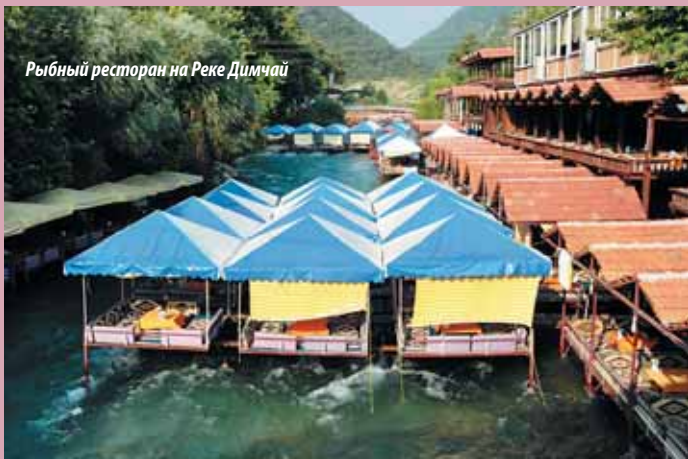
Рыбный ресторан на Реке Димчай