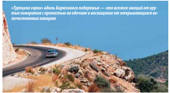
«Турецкие горки» вдоль Бирюзового побережья — это всплеск эмоций от крутых поворотов с пропастью на обочине и восхищение от открывающихся величественных панорам