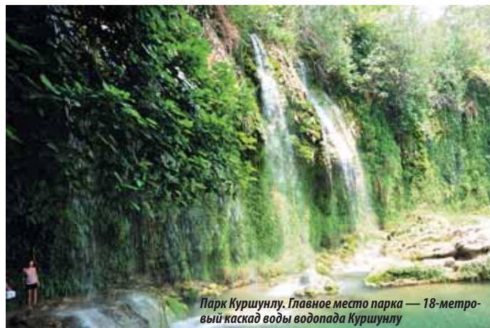
Парк Куршунлу. Главное место парка — 18-метровый каскад воды водопада Куршунлу