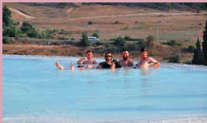
Памукалле. Возвышающееся на 100 м плато образовалось благодаря минеральному источнику, который вытекает на вершине. Испаряясь и смешиваясь с затвердевшим мелом, (травертином) водопад тысячами превращается в белые, алые и розовые каскады, ниспадающие на окрестности