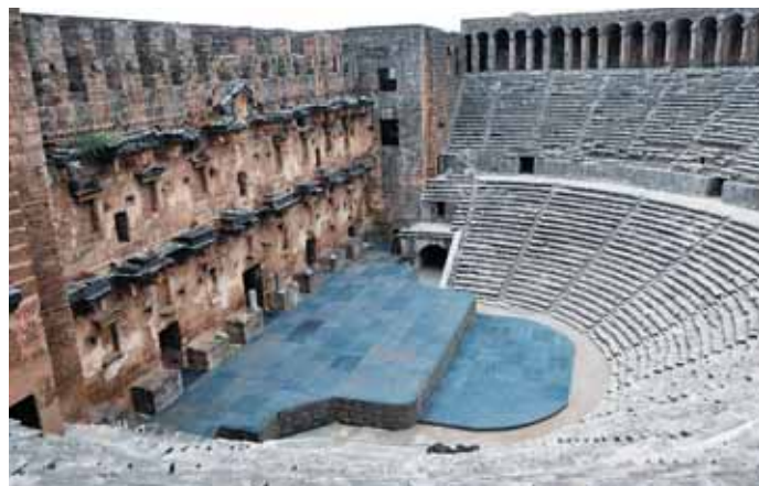
Аспендос. Был построен во 2-м веке и вмещал 12000 зрителей (как сейчас — приличный стадион), впервые в театральном деле были применены декорации