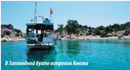
В Заповедной бухте островов Кекова