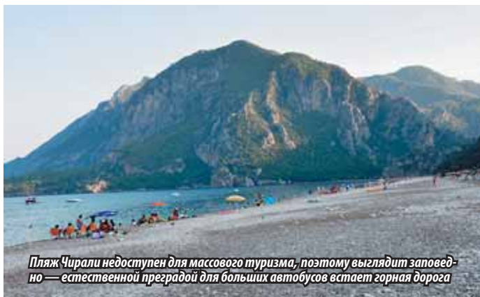
Пляж Чирали недоступен для массового туризма, поэтому выглядит заповедно — естественной преградой для больших автобусов встает горная дорога

В двух километрах от Церкви Святого Николая расположены ликийские гробницы Миры и греко-римский театр , который после Аспендоса выглядит не слишком масштабно, да к тому же подорван землетрясением. К гробницам близко не подойдешь (и вообще непонятно, за что взимают плату в 15 лир — все хорошо просматривается из-за пределов «платной» зоны). Честно говоря, гробницы (аналогов которым в мире больше нет) на фото выглядят более впечатляюще, чем в реальной жизни.