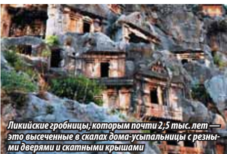
Ликийские гробницы, которым почти 2,5 тыс. лет — это высеченные в скалах дома-усыпальницы с резными дверями и скатными крышами

ную (когда дорога круто взмывает к небесам), или в морскую пучину. И неважно, на какой высоте ты петляешь — за каждым поворотом открывается все более эпические панорамы — бирюзовая гладь моря, незыблемость уходящих в такую же бирюзовую глубину неба скал и заповедные бухточки — где-то совсем пустынные, а где-то (поближе к курортам) кипящая жизнью.