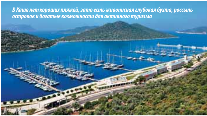
В Каше нет хороших пляжей, зато есть живописная глубокая бухта, россыпь островов и богатые возможности для активного туризма