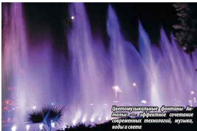
Цветомузыкальные фонтаны Анталии — эффектное сочетание современных технологий, музыки, воды и света

Аренда авто — 180 лир (3240 руб.), бензин — 372 лиры (6696 руб.), ночевка в пансионе с завтраком — 50 лир (900 руб.), входные билеты — 93 лиры (1674 руб.), аренда яхты (2 часа) — $25 (800 руб.), парковка — 10 лир (180 руб.).