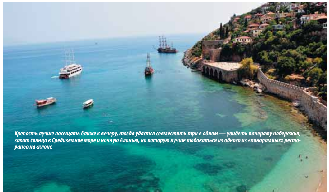
Крепость лучше посещать ближе к вечеру, тогда удастся совместить три в одном — увидеть панораму побережья, закат солнца в Средиземном море и ночную Аланью, на которую лучше любоваться из одного из «панорамных» ресторанов на склоне

«Хлопковый замок» произвел на меня потрясающий эффект, пожалуй, это самое сильное впечатление от поездки. Отнесу это место в список собственных «чудес света», наряду с Ниагарским водо-