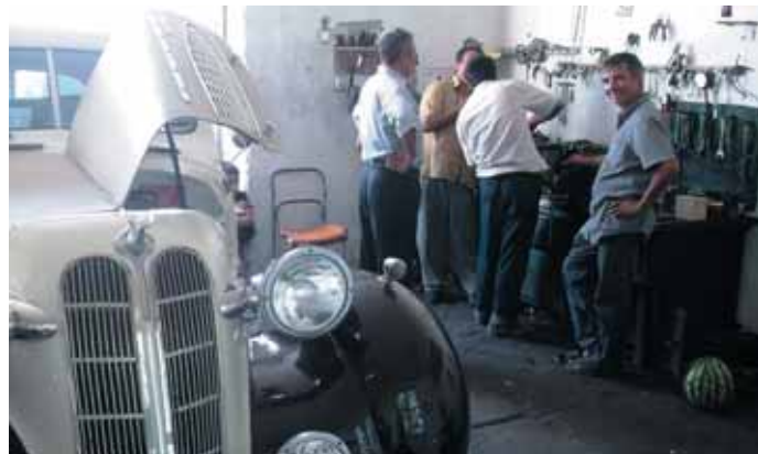
Автосервис в Казахстане и Узбекистане – привет из советского прошлого. Какое там специальное оборудование – в одной из так сказать СТО долго искали хоть какой-то обломок сверла. Но люди душевные и всегда готовые помочь