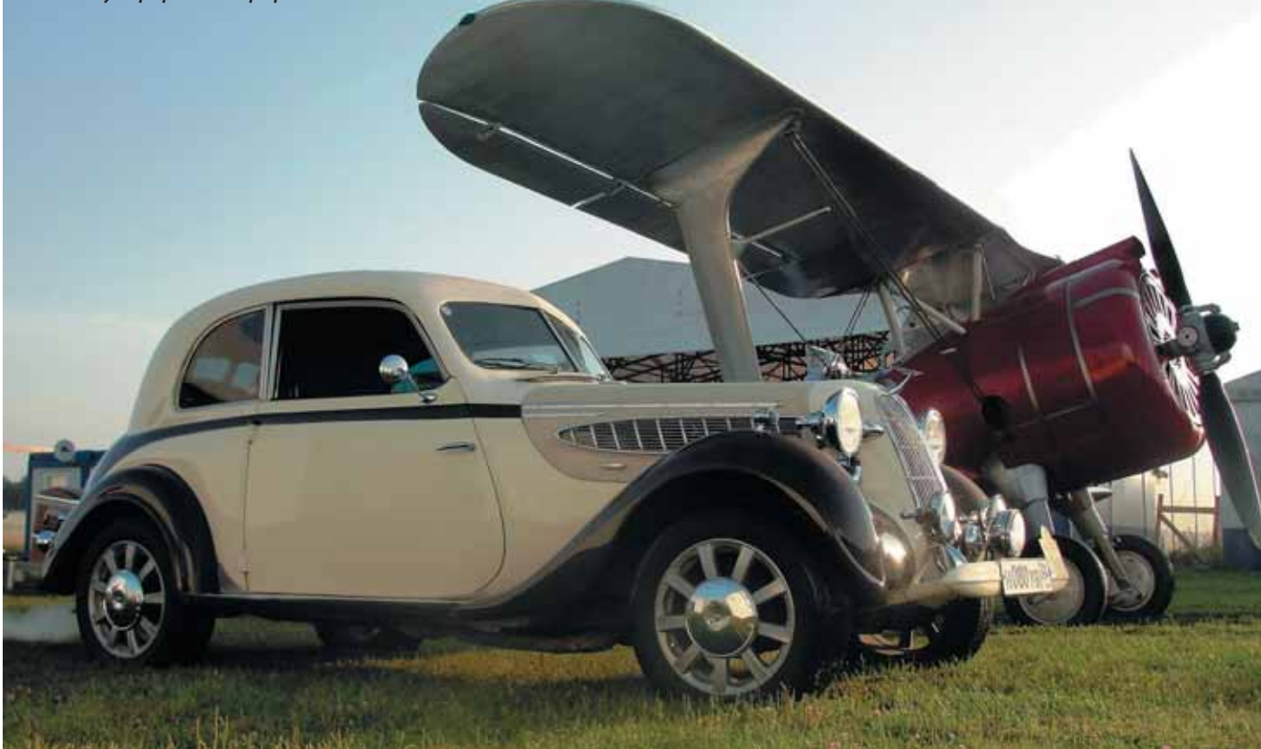
Фото на одном из частных аэродромов в западной части России. И-15 и BMW-321 ровесники (первый появился в 1933-34 гг., второй в 1938-м), но детища разных идеологий. Впрочем, перед войной такое соседство наверняка можно было бы наблюдать на каких-нибудь приграничных аэродромах