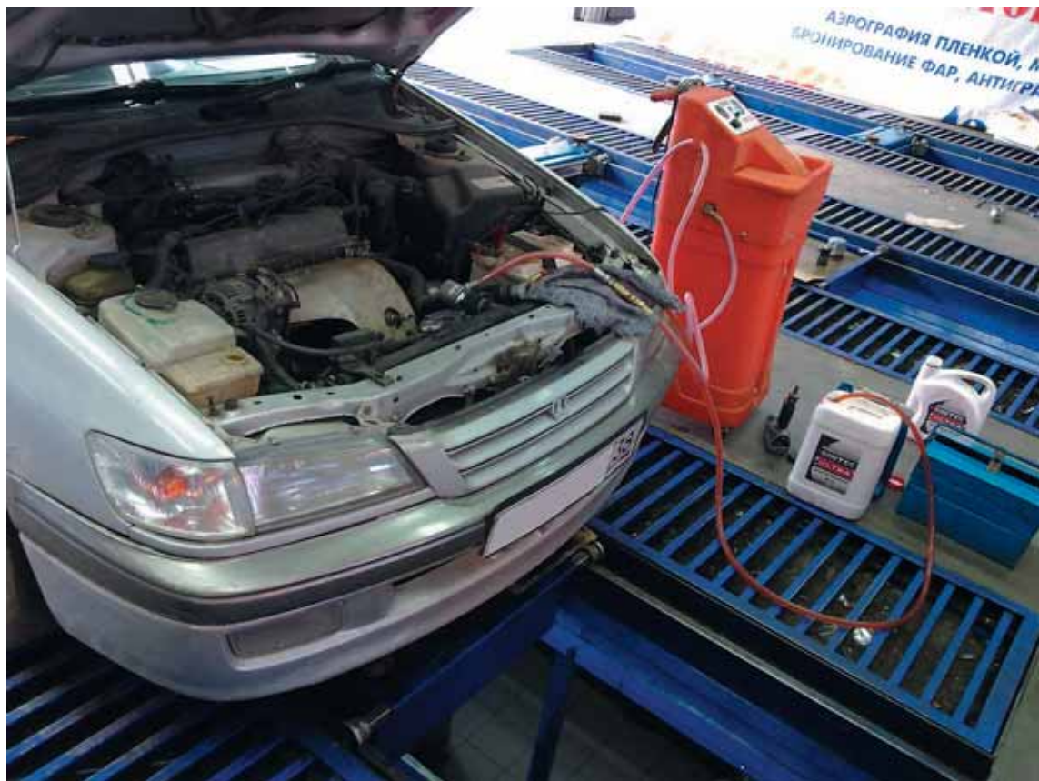
Часть залитых в наш автомобиль техжидкостей были недавно заменены. Повлияет ли это на вердикт мастеров при диагностике готовности машины к зиме?

ОБЪЕКТ ИССЛЕДОВАНИЯ: Toyota Corona Premio, 1996 года выпуска. В автомобиле в августе были заменены: моторное масло (полностью), антифриз (полностью), жидкость в АКПП (частично). Воздушный фильтр не загрязнен, свечи и аккумулятор — в рабочем состоянии. Также имелось незначительное подтекание антифриза, из-за чего его уровень на момент диагностики находился у минимальной отметки.