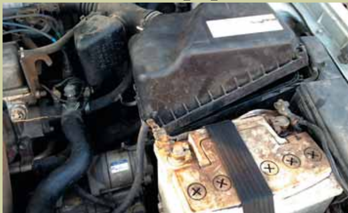
Картина маслом: а что у вас с фильтром??? К сожалению, иногда диагностика автомобиля оставляет и такие результаты как снятый и «забытый» мастером воздушный фильтр...

ет на состояние этой техжидкости, что и отмечалось большинством мастеров.