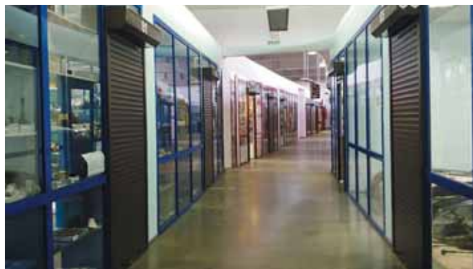
Ориентироваться среди многочисленных павильонов торговых центров не всегда просто — особенно если отсутствуют вывески над павильонами...

требуют только отдельные элементы узлов, то такой вариант может оказаться предпочтительнее. Кроме того, при наличии в торговом центре нескольких павильонов всегда есть возможность сравнения (в том числе и очного) деталей от разных производителей и выбора из них лучшего варианта. Наконец, в торговых центрах, как правило, необходимые детали практически всегда есть в наличии (в худшем случае потребуется подождать доставки со склада от нескольких минут до часа-двух).