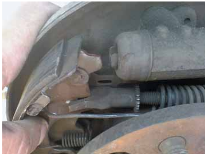
Обычно механизм разводки колодок проблем не доставляет: в нашем случае налицо редкий пример механической поломки

чем, нередко также можно заказать в подобных фирмах). Однако при заказе контрактного узла вы не сможете оценить его работоспособность до установки на машину: в лучшем случае, если узел есть в наличии, его можно проверить визуально на предмет возможных видимых механических повреждений или износа. Соответственно, при покупке будет не лишним поинтересоваться не только гарантией, но и возможностями фирмы по установке узла на автомобиль — в этом случае, если узел все-таки окажется дефектным, все непредвиденные расходы по монтажу-демонтажу можно возложить на продавца. Но сэкономить не получится: средняя стоимость контрактной рулевой рейки составляет все те же 3–3,5 тысячи рублей (лучшее предложение — чуть более 2 тысяч с ожиданием в две недели). А меха-