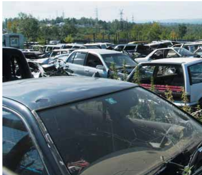
Авторазборки нельзя считать российским ноу-хау, однако в цивилизованных странах подобные места называют проще — автосвалками

ЧТО ЕСТЬ? Популярность того или иного автомобиля при поиске запчастей на разборках может носить двоякий характер: редкие модели и в разборе встречаются нечасто, однако и востребованность запчастей для них также ниже, в то время как наиболее дефицитные узлы на популярные модели, особенно если они в хорошем состоянии, расходятся достаточно быстро, и в этом случае на расчленение узла лучше не надеяться — если даже и найдете на разборке рулевые наконечники, их стоимость будет никак не ниже аналогичных новых. А вот найти механизм разводки колодок удалось достаточно быстро, причем не в одной разборке. При этом запросили за действительно редкую деталь в два раза ниже стоимости новой.